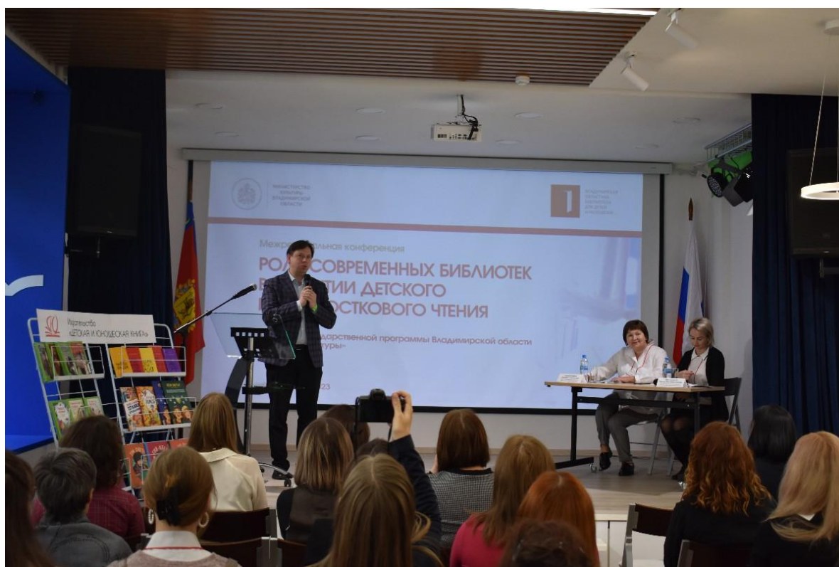
Официальное приветствие заместителя министра культуры Владимирской области О.Н. Гуреева